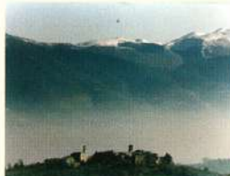
Colle del Marchese

I monumenti: a la Bruna è di un certo interesse il santuario rinascimentale della Madonna della Bruna, a forma di croce, con unica navata e tre absidi. Per quanto riguarda Castel Ritaldi, si faccia riferimento ai monumenti descritti nel percorso n. 21. A Colle del Marchese da vedere i resti del castello e la chiesa di S. Pancrazio.