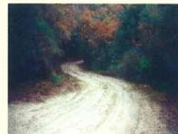
Pomonte, Sentiero nel bosco