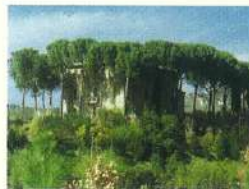
Pomonte, Palazzo baronale

I monumenti: da ammirare il Palazzo baronale fatto costruire nel 1445 dal Papa Gregorio XIII per la propria famiglia, nonché i ruderi del Castellaccio* fortificazione fatta costruire dai gualdesi presumibilmente nel 1130. I maestosi resti del Forte di Sorgnano sulle colline a Nord di Pomonte (tra il Fosso Rubbiantino ed il Fosso dell'Uliva), raggiungibili dalla località Cerquigno, costituiscono una particolare attrattiva.