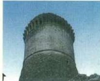
La Rocca di Gualdo Cattaneo