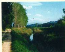
Teverone, scorcio del percorso

I monumenti: a Bevagna da ammirare nel centro storico importanti reperti romani (resti di un teatro, di un tempio, di una casa e bellissimi mosaici) e medievali (come il Palazzo dei Consoli, la chiesa di S. Silvestro, di S. Michele, dei SS. Domenico e Giacomo, la chiesa di S. Francesco e le mura urbane quasi intatte con porte e torrioni). A Torre di Montefalco la massiccia torre medievale, il ponte del Rosciolo ed i resti di un vecchio mulino ad acqua del 1561.