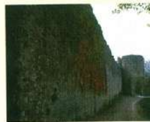
Bevagna, torre orielata