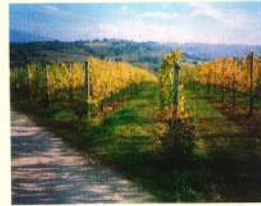
Montefalco, vigneti dell'Arquata