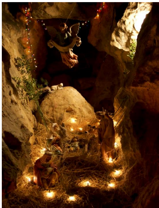
Presepe in grotta - Cesi