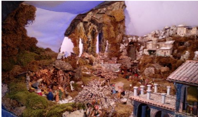
Presepe artistico - Montefranco