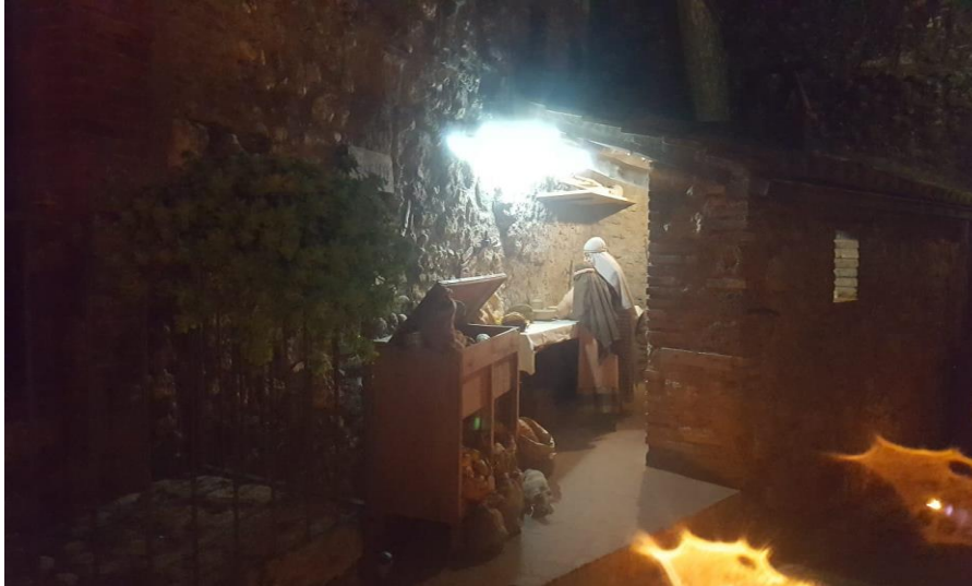
Presepe vivente di S.Vito - Narni