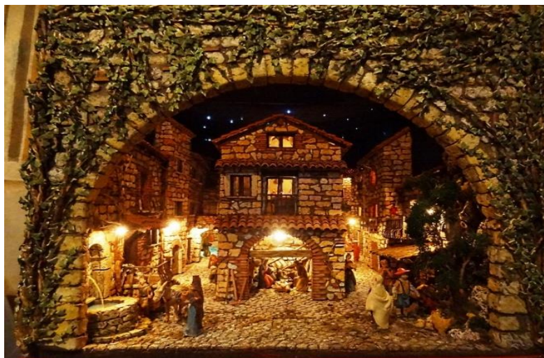
TerniInPresepe 2017 -2018