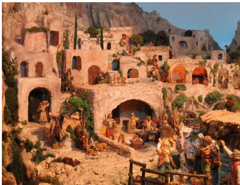
Presepe artistico di Ferentillo