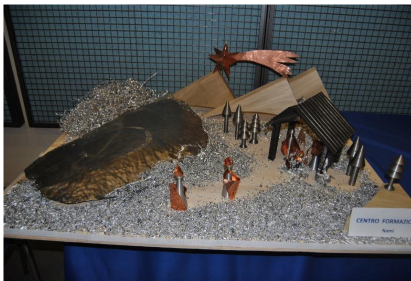
Presepe Mostra artigiani - Camera di Commercio 2017 - 2018