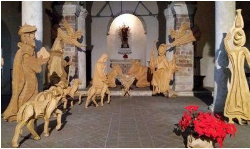
Presepe artistico - Narni S.Maria Impensole