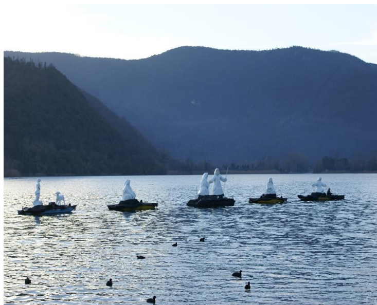
Piediluco - Presepe su lago