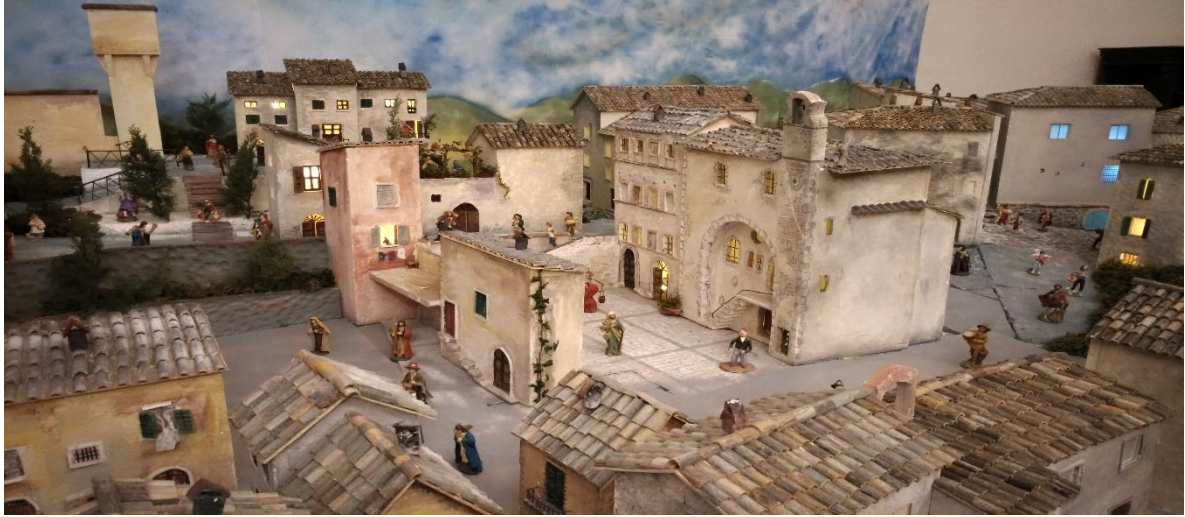
Presepe artistico - S.Gemini