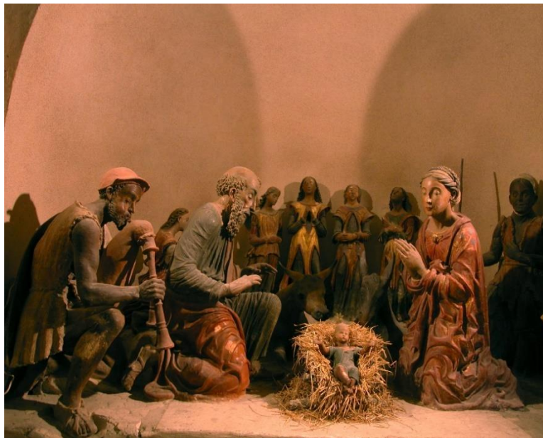
Calvi - Presepe artistico monumentale

Accessibile ai disabili dall'ingresso della casa del giovane (vicino alla Chiesa)