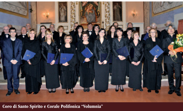
Coro di Santo Spirito e Corale Polifonica "Volumnia"